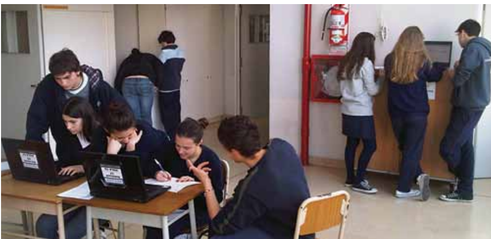
Pasillo de los laboratorios convertido en centro de cómputos.