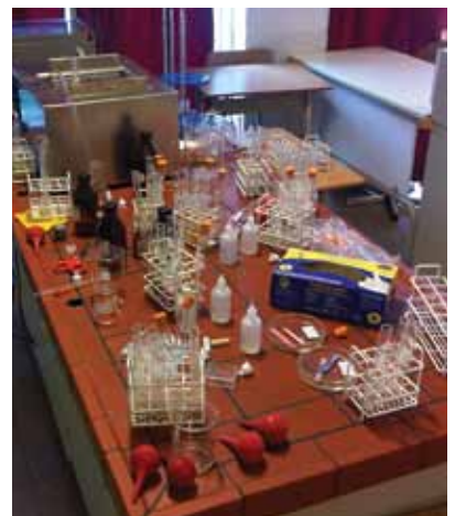
“¡Nadie se va del aula sin haber lavado y ordenado antes...!”