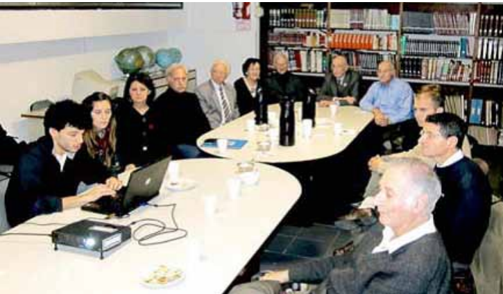
Vista de la reunión

Contamos con la asistencia de 14 exalumnos, que escucharon atentamente la presentación y comentaron diversos aspectos, manifestando su interés en el proyecto. Luego de haber celebrado reencuentros después de mucho tiempo, disfrutado del refrigerio y de la charla, la reunión se dio por finalizada quedando abierta una futura convocatoria para considerar el proyecto del estatuto.