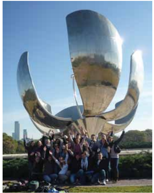
Alumnos alemanes de intercambio durante una excursión, bajo la “flor gigante” del arquitecto Eduardo Catalano.

Eine weitere Erfahrung hier für mich war das Eintauchen in eine ganz andere Kultur. Da man ja in der Gastfamilie wohnt und nicht in einem Hotel, in dem man sein deutsches Brot frühstücken kann, musste man sich deren Gewohnheiten anpassen und hat somit meiner Meinung nach viele wichtige Erfahrungen gesammelt. Auch habe ich durch die Unterschiede erst gemerkt, was eigentlich meine Kultur ist.