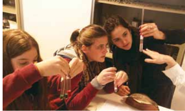
Alumnos descubriendo una cura para el increíble Hulk.

Implica poder aplicar el conocimiento de la ciencia a situaciones cotidianas, desde entender si conviene o no tapar la olla para hervir agua, hasta por qué no se recetan antibióticos cuando se tiene una gripe de origen viral.