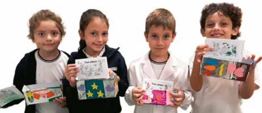
Die Schüler und Schülerinnen der 2. Klasse

Unsere Sätze werden nach und nach etwas länger. Stellt euch vor: Wir können schon Sätze mit dem Wort denn!!! Noch schreiben wir mit dem Bleistift, aber das wird sich bald ändern. Sobald die Buchstaben sicher auf den Zeilen sitzen, ... dann kommt der Füller in die Hand. Und ihr werdet es sehen.... bald schreiben wir lange Texte, und das ganz alleine!