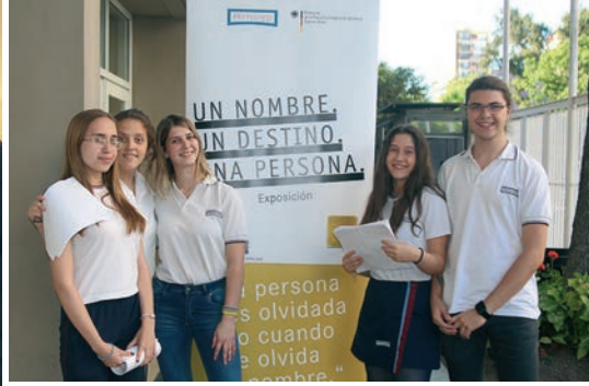
Algunos de los alumnos de 42 año que colaboraron el día del acto.