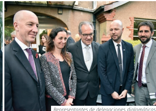
Representantes de delegaciones diplomáticas.