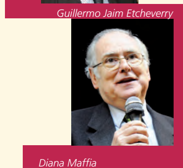
Guillermo Jaim Etcheverry