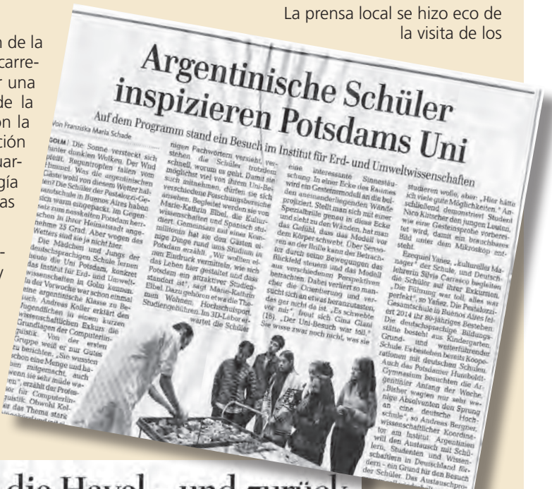
Artículo de "Potsdamer Neueste Nachrichten".

La prensa local se hizo eco de la visita de los