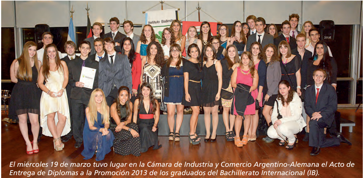
El miércoles 19 de marzo tuvo lugar en la Cámara de Industria y Comercio Argentino-Alemana el Acto de Entrega de Diplomas a la Promoción 2013 de los graduados del Bachillerato Internacional (IB).

En la presente edición de este tradicional encuentro, compartido por el Instituto Ballester y por el Colegio Pestalozzi desde hace varios años, se le dio la bienvenida al Colegio Alemán de Temperley.