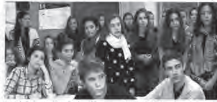
Eng wie in Buenos Aires. In einem Klassenzimmer des Humboldt-Gymnasiums wurden die rund 30 argentinischen Schüler von den Potsdamern empfangen.

tät Potsdam, hat er im Rahmen einer schulfremden Kontakt aufgenommene und über die Möglichkeiten eines solchen gesprochen. „Wir haben großes Interesse daran, dass zum Beispiel Austauschstudenten ihr Praxissemester im Ausland absolvieren können.“ Frau Neum-Flux. Das sei bislang Ausnahmefällen möglich. „Aber möchten wir uns dafür einsetzen, Schüler nach ihrem Abschluss in Deutschland zu studieren“, so Neum-Flux. Schüler der Pestalozzi-Schule, die vor nunmehr zwölf Jahren das Geminigebäude Internationale Bacc (GIB), das in spanischer und in deutscher Sprache abgelegt wird und als Schulzugangsberechtigung in Argentinien gilt. Erste Gespräche, um ein Partnerschaftsvertrag zu schließen, reits gegeben. Nächste Woche werden Organisatoren von Uni und Pestalozzi aus und beraten, wie es tergehen soll – damit künftig auch mer Schüler Buenos Aires besu-