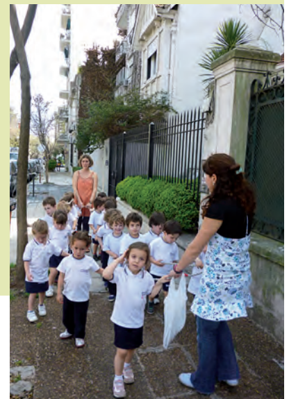
Equipo de las salas de 3

5. Se hizo la hora de volver al Jardín... El camino de ida y de vuelta enseñó un montón de cosas, porque también pudimos mirarlo con "otros ojos" y poner en práctica todo lo conversado previamente en la escuela sobre la seguridad vial, mientras caminábamos por las veredas y al cruzar la calle.