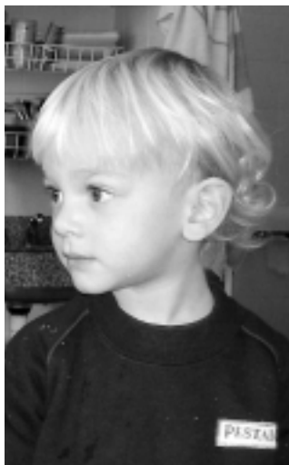
Sala de Vero:

El cráneo: Sirve para proteger el cerebro Se usa para indicar todas las cosas del cuerpo que se quieren hacer.