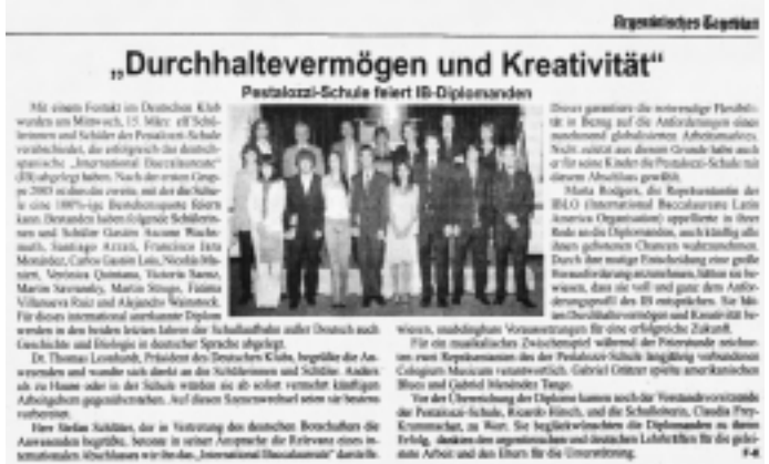
Facsímil del artículo publicado en el Argentinisches Tageblatt el 25.03.2006 con motivo de la entrega de diplomas IB a nuestros alumnos el día 15 de marzo de 2006 en el Club Alemán.

El Colegio agradece al plantel docente que los acompañó con gran esfuerzo y compromiso en su preparación.