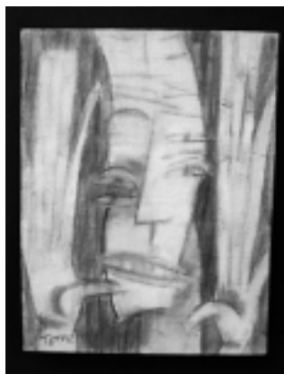
"Testimonio", óleo sobre tela

Miércoles 8 de junio, 19 hs. hasta el 30 de junio