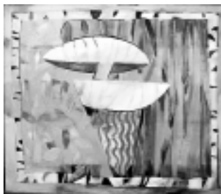
"Brujo del cañaveral", óleo sobre tela